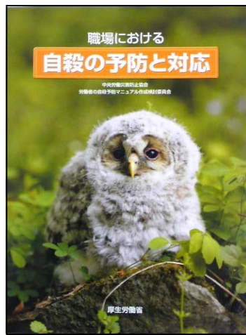
中央労働災害防止協会 「職場における自殺の予防と対応」

統計で見ると、千葉のなかでは柏警察署管内がもっとも自殺者数が多いという記事が載ったことがあります。